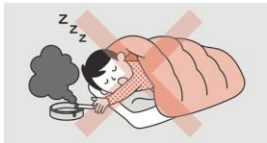
①寝たばこは絶対にしない、させない