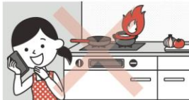
③こんろを使うときは火のそばを離れない