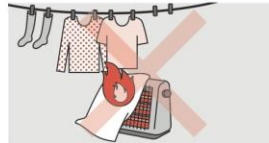
②ストーブの周りに燃えやすいものを置かない