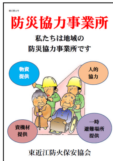
掲示用標識（様式第4号）